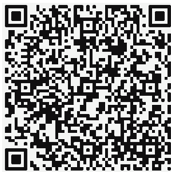
Obr. 1 Ukázka QR kódu

Papírové jednorázové jízdenky systému Kraje Vysočina budou obsahovat textové informace o jízdence a rovněž údaje pro identifikaci i kontrolu platnosti jednorázové jízdenky, uložené v QR kódu. Údaje, uložené v tomto kódu, musí minimálně obsahovat číslo jízdenky a údaje pro kontrolu časové, relační a zónové platnosti jízdenky. Automatizovaná kontrola těchto jízdenek v autobusech i ve vlacích bude využívat shodný modul kontroly, jako pro předplatní časové jízdenky, přiřazené k bankovní nebo povolené dopravní BČK. Data v QR kódu budou rovněž obsahovat digitální podpis SAM. Záznam pro kontrolu jízdenky VDV v QR kódu musí splňovat všechny požadavky zónově-relačního Tarifu VDV a Smluvních přepravních podmínek VDV.