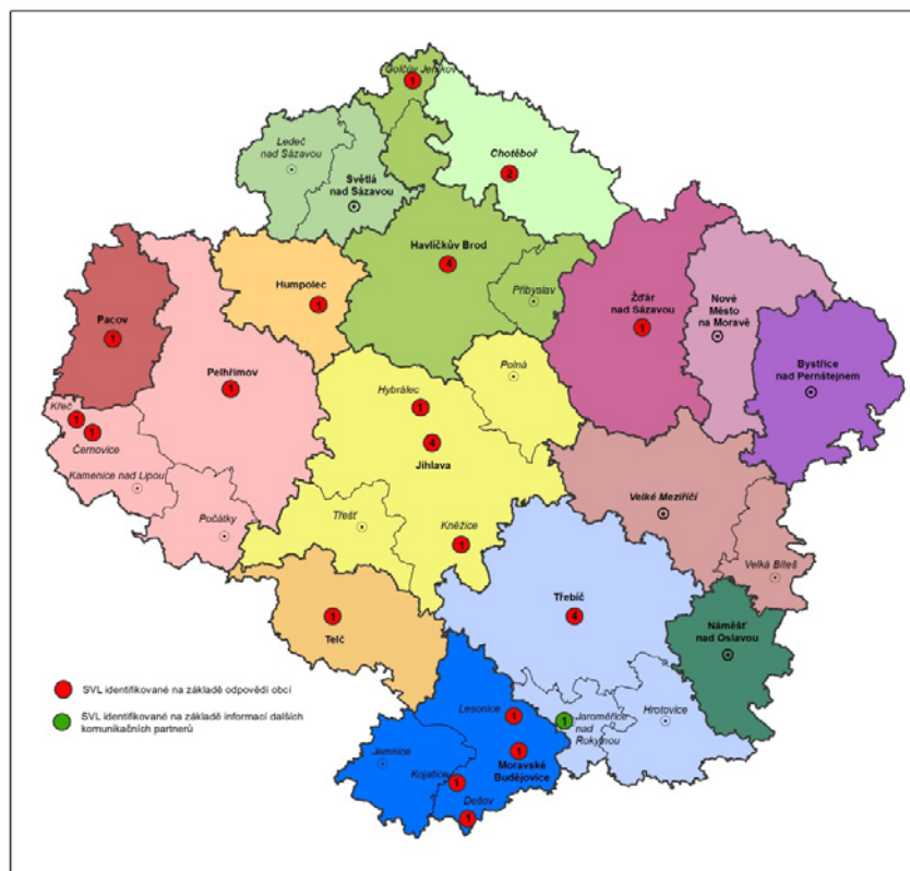
Mapa č. 1 – Prostorové rozložení SVL v Kraji Vysočina.

Mapa č. 1 znázorňuje rozložení SVL v celém Kraji Vysočina dle jednotlivých ORP. Jedná se o data získaná především z výše citovaných analýz.