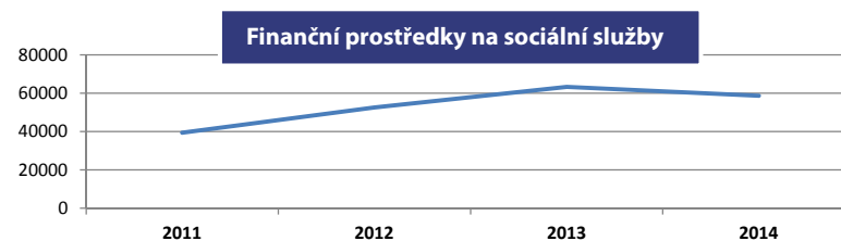
Graf č. 1 – Výše finančních prostředků z rozpočtu Kraje Vysočina určených na sociální služby (v tis. Kč).

Rozpočet Kraje Vysočina – jedním z důležitých krajských zdrojů financování oblasti eliminace sociálního vyloučení jsou finance určené přímo z rozpočtu Kraje Vysočina.