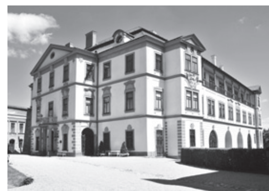
^ Zámek Velké Meziříčí

Jde o jeden z největších známých komplexů mravenišť lesních mravenců druhu Formica polyctena v České republice. Na území přírodní památky Šebeň se vyskytuje asi 1 100 hnízd lesních mravenců druhu Formica polyctena. Mraveniště se nacházejí na světlejších stanovištích – podél cest, okrajů porostů, pasek, světlin atd. Mraveniště tvoří tzv. liniiovou strukturu. Ke vzniku dceřiných hnízd v koloniích dochází především ve směru linií, při nichž se nacházejí mateřská hnízda. V roce 2006 zde Český svaz ochránců přírody otevřel naučnou stezku dlouhou asi tři kilometry, na jejíž trase je umístěno dvanáct informačních panelů. Území leží mezi obcemi Dobrá Voda, Cyrilov a Jivoví.