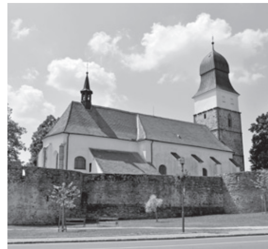
^ Kostel sv. Jana Křtitele, Velká Bíteš