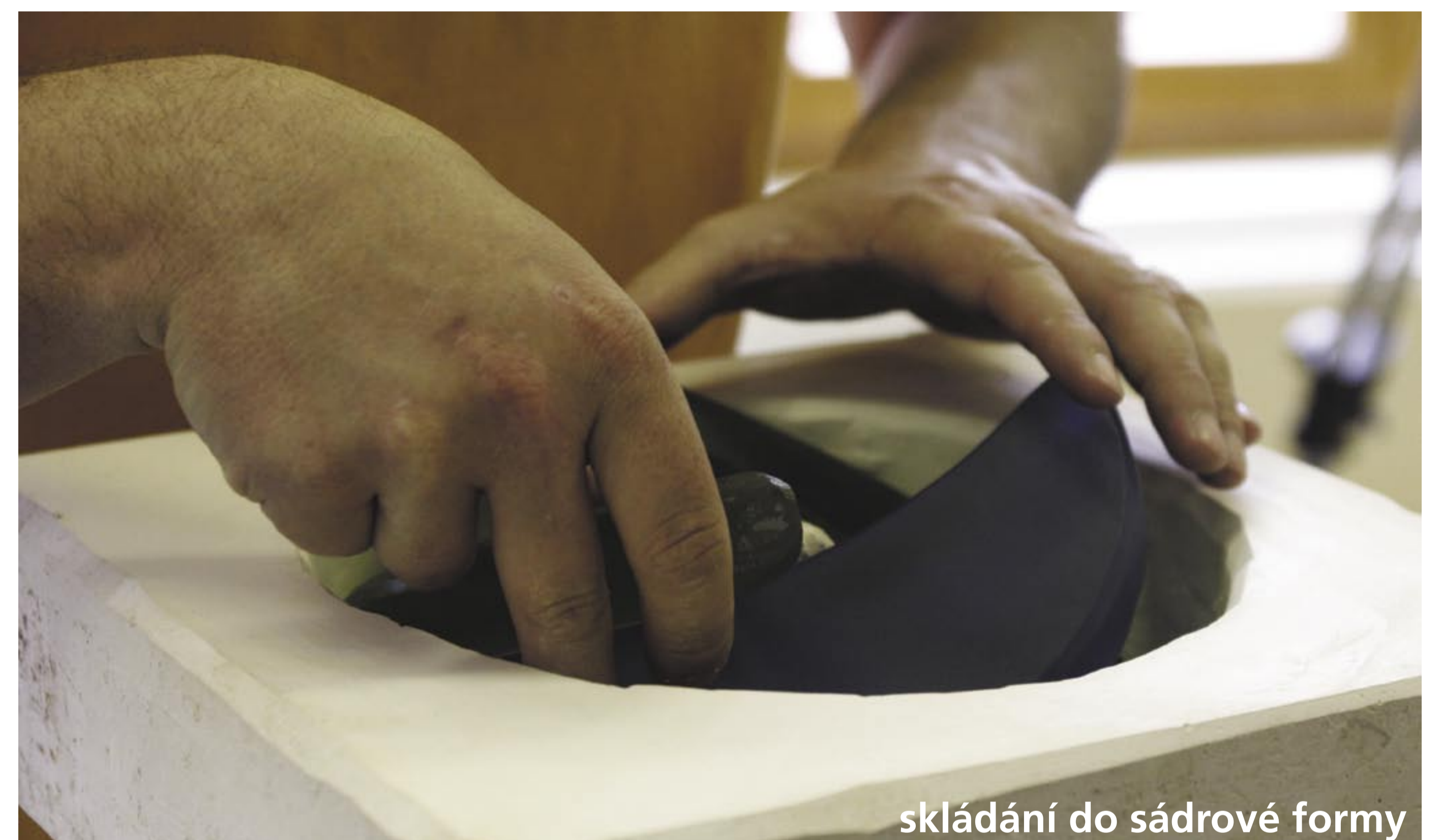
skládání do sádrové formy

Skláři vyrobí sádrovou formu s vnitřním trnem pro budoucí otvor v medaili. Modré, zelené a čiré sklo sbrousí do půlměsíčných segmentů. Ty pak naskládají do sádrové formy tak, aby se navzájem překrývaly. Formu zahřívají ve sklářské peci tak, aby se jednotlivé segmenty slily do kotouče, přitom se ale barvy nesmísily. Jde o takzvané lehané sklo. Hotový kotouč budoucí medaile je pak po obvodu zabroušen a motivy jsou podle výtvarnickova návrhu na povrch medaile vyryty a vypískovány.