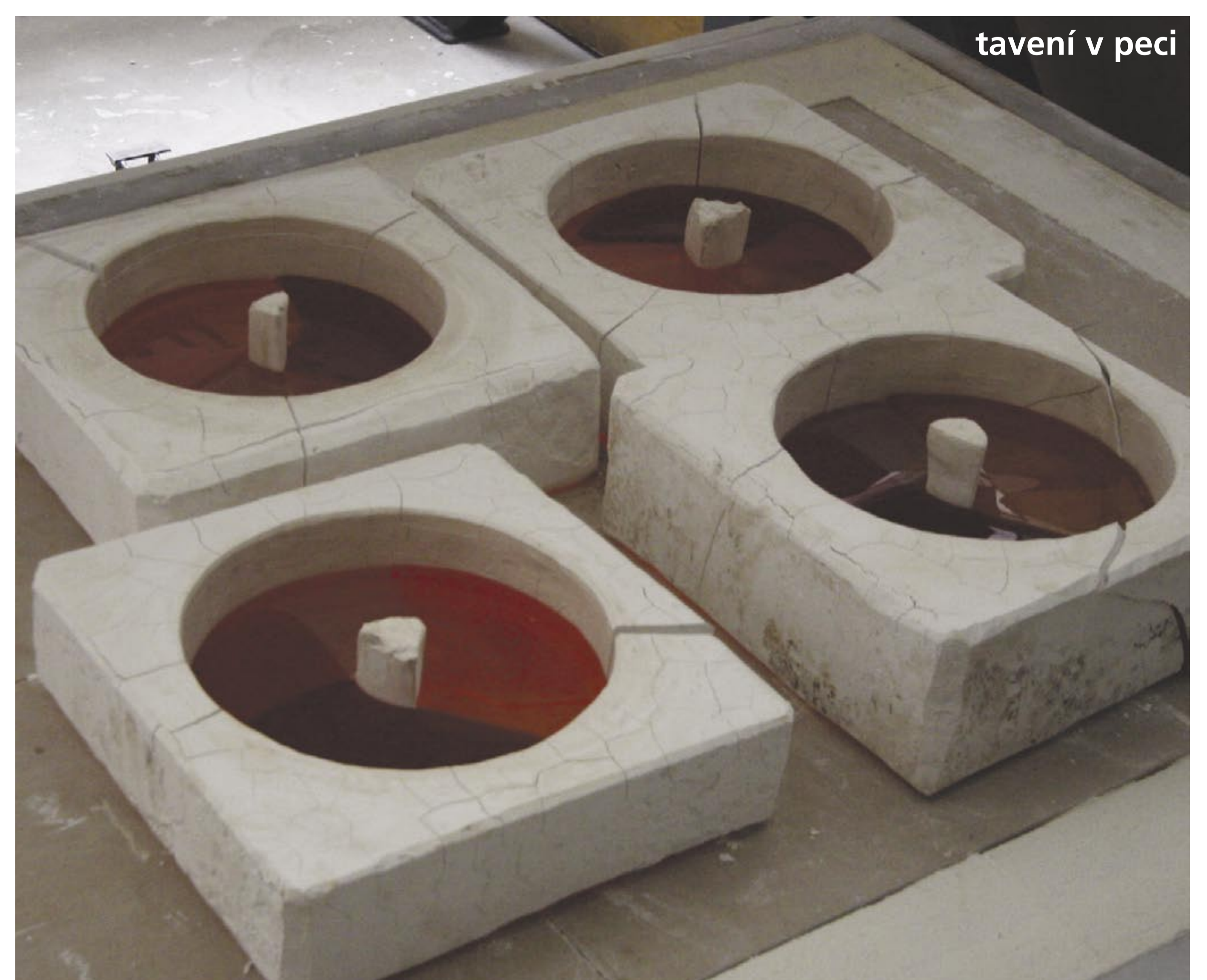
tavení v peci