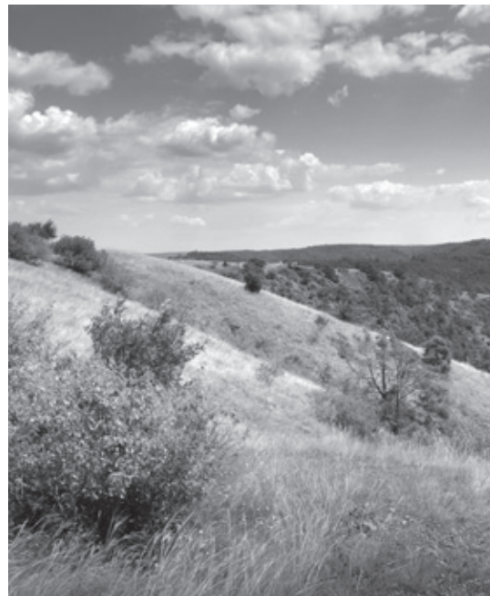
^ Národní přírodní rezervace Mohelenská hadcová step

Jedná se o rozsáhlý a velmi cenný komplex přírodě blízké zejména lesní, ale i nelesní vegetace, tvořené zejména hercynskými dubohabřinami, suťovými lesy, acidofilními teplomilnými doubravami, úzkolistými suchými trávníky, skalní vegetací s kostřavou sivou, štěrbínovou vegetací silikátových skal a drolin a makrofytní vegetací vodních toků a výskytom celé řady ohrožených druhů rostlin a živočichů. Pro svou divokost a jedinečnost přírodní scenerie je území častým a vyhledávaným turistickým cílem.